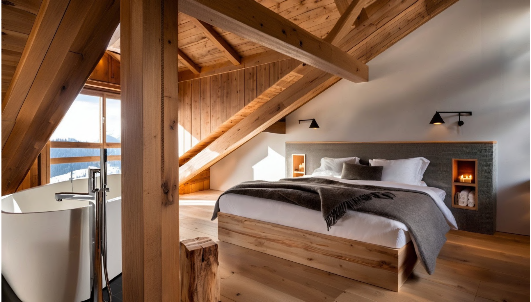
Chambre / Bedroom