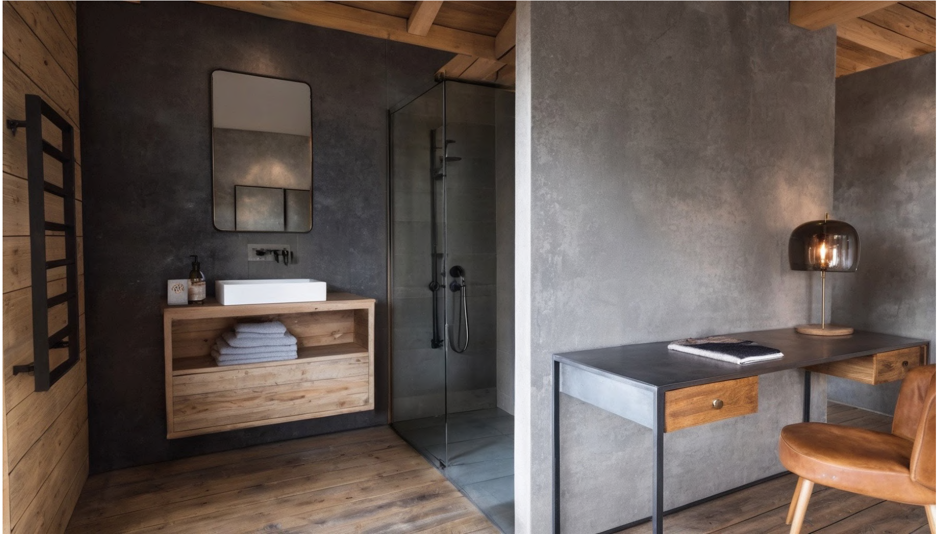
Chambre Master / Master bedroom