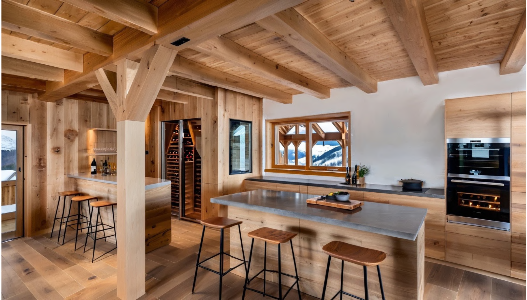
Cuisine / Kitchen