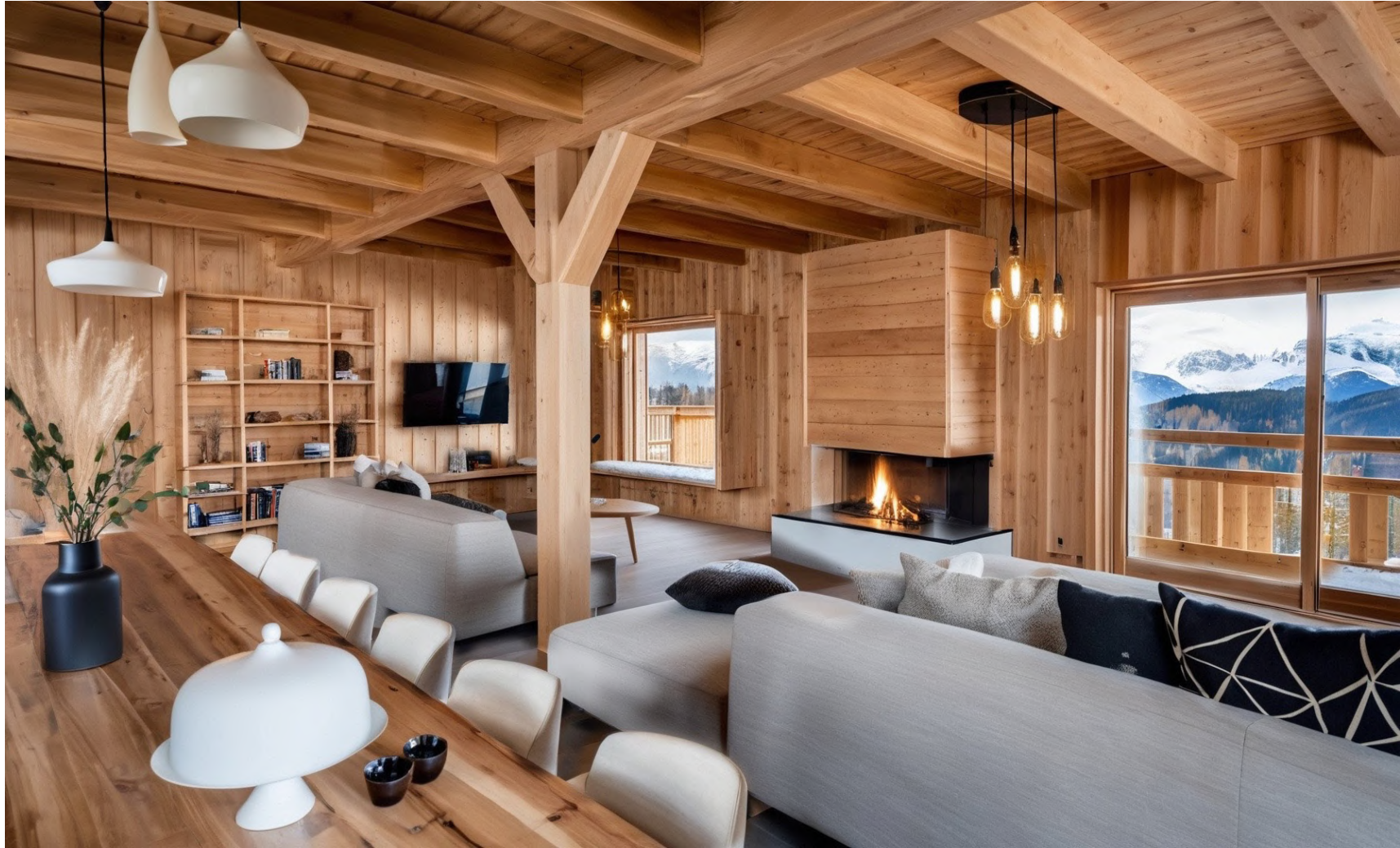
Salon / Lounge