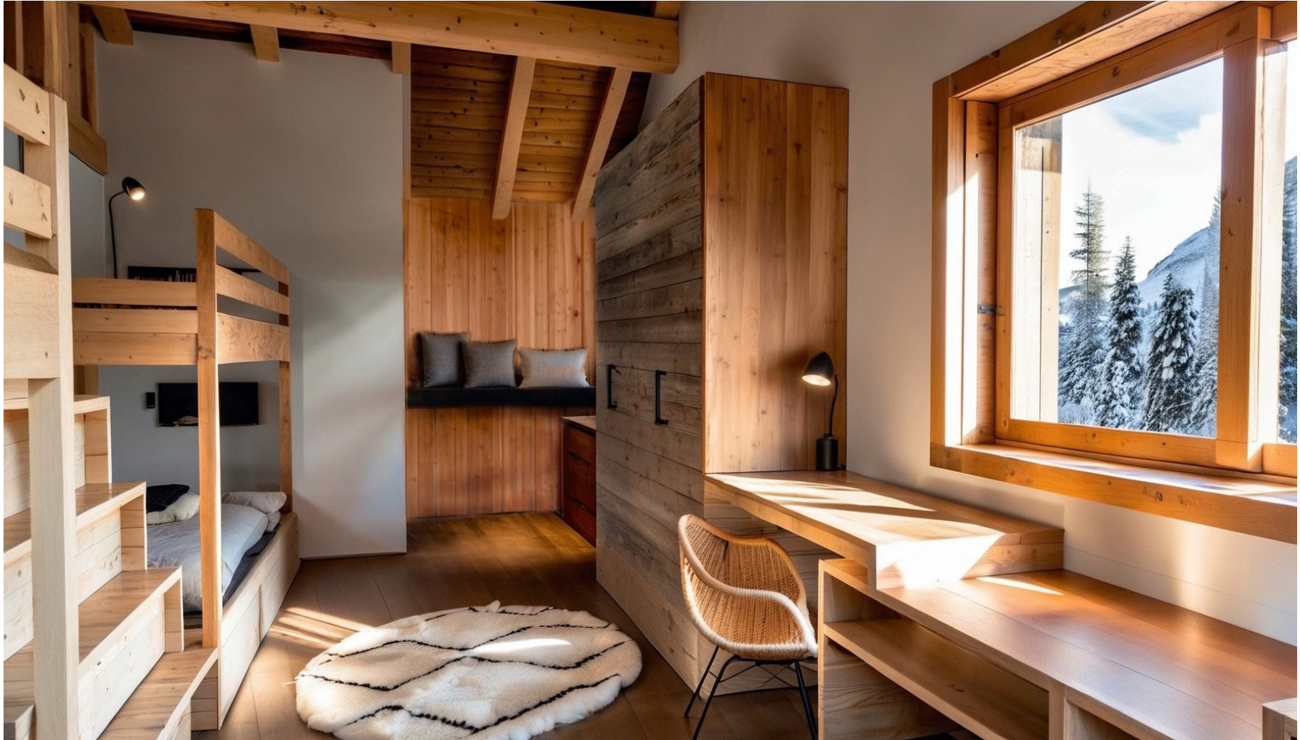
Dortoir / Dormitory