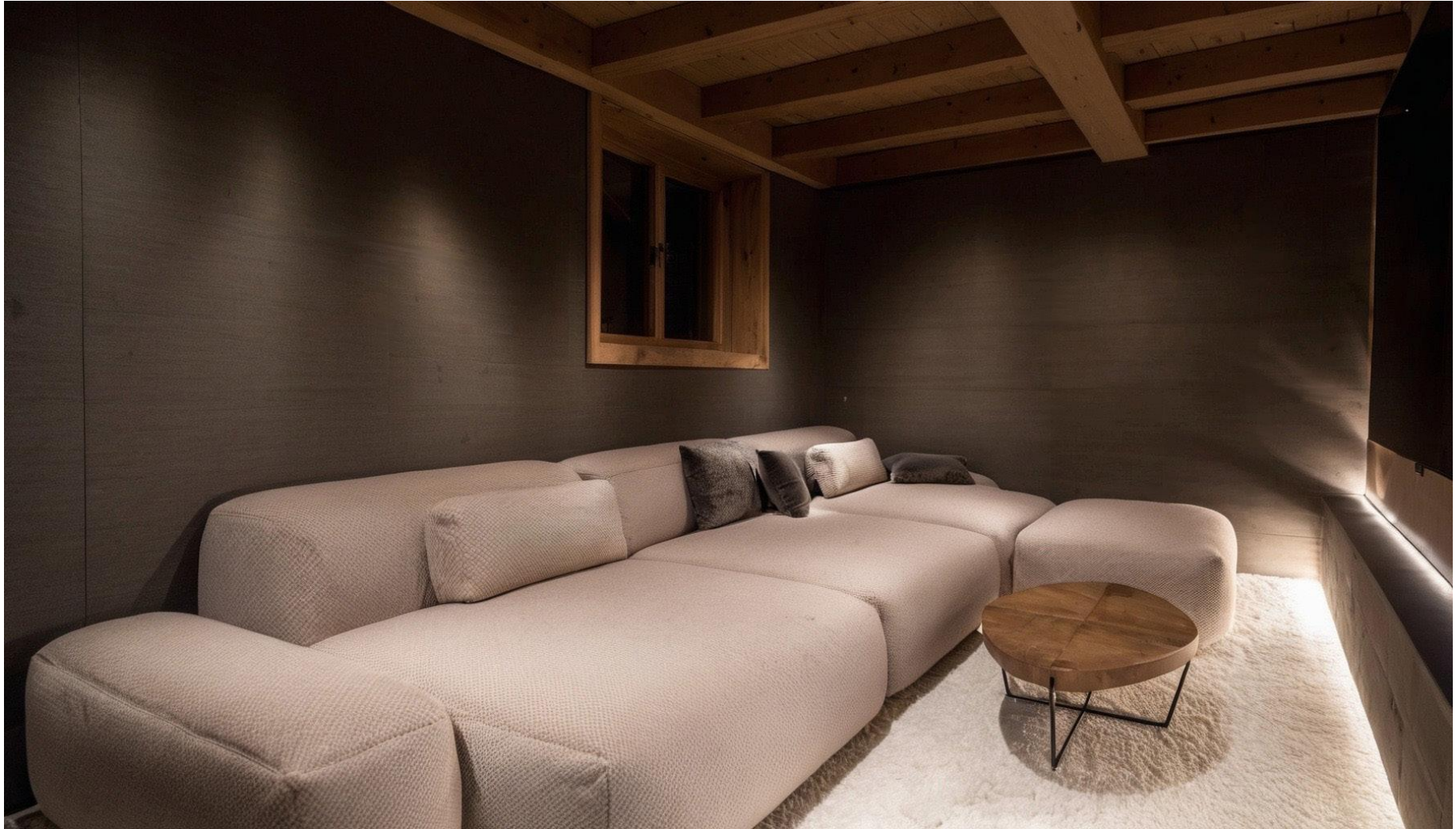
Salle de cinema / Home cinema