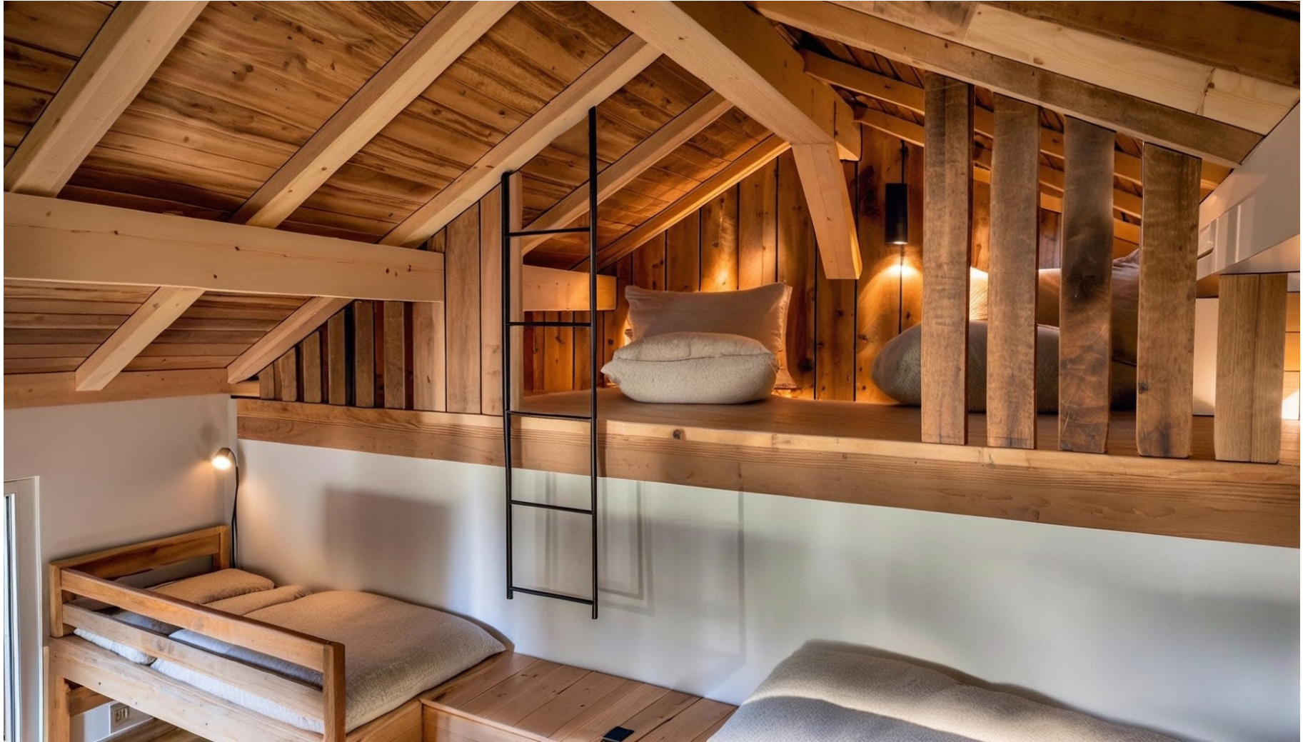
Dortoir / Dormitory