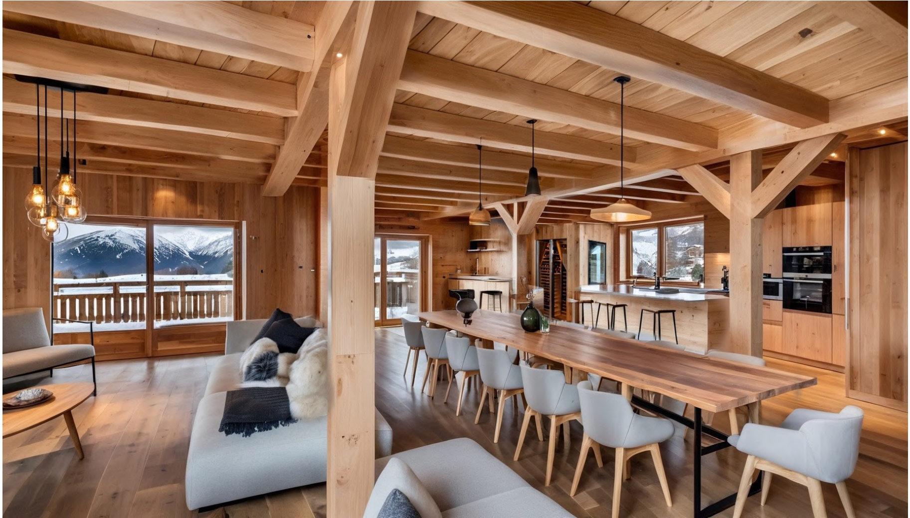
Salle a manger / Dining room