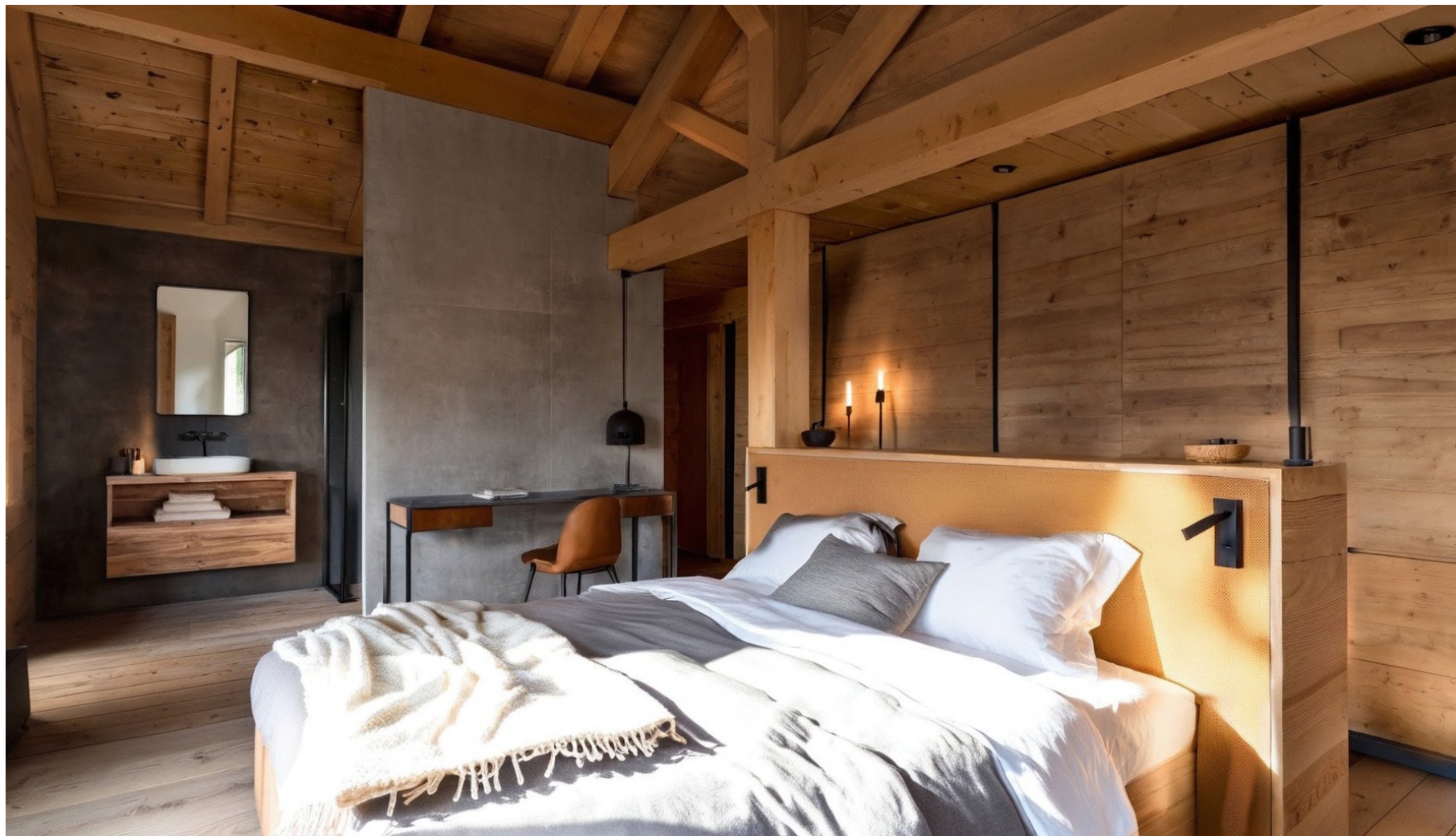
Chambre Master / Master bedroom