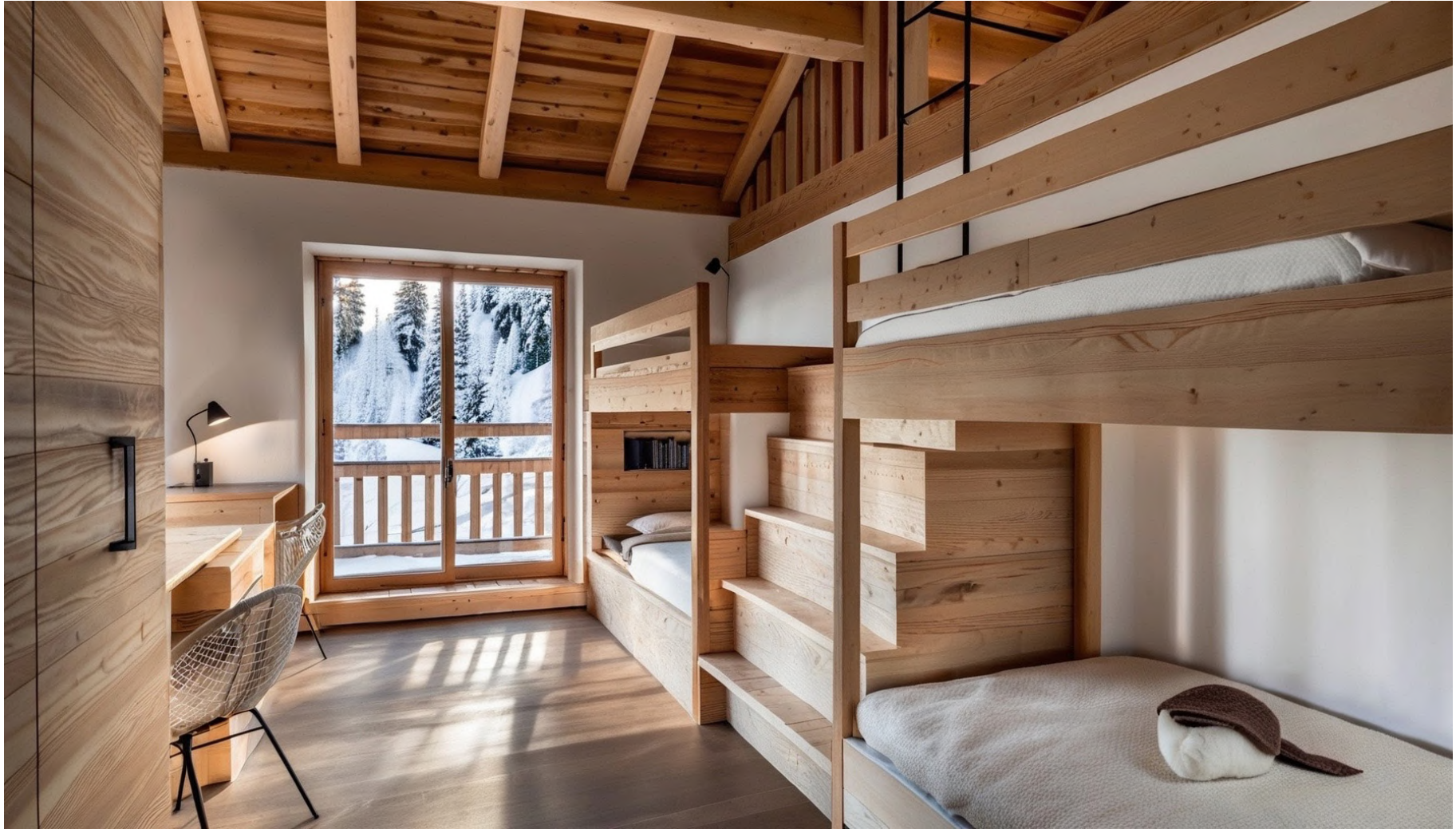
Dortoir / Dormitory