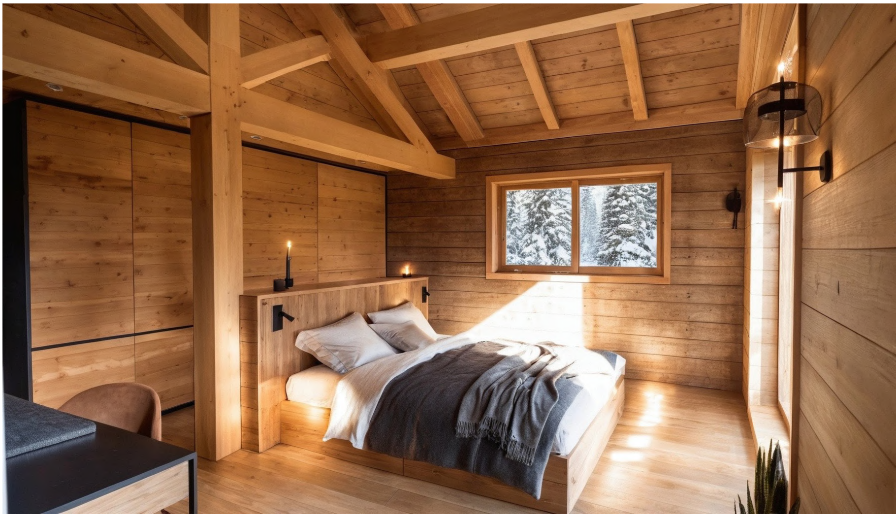
Chambre / Bedroom